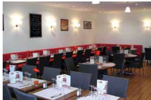
PARIS / 2005 / BRASSERIE CHEZ GEORGES SAINTES