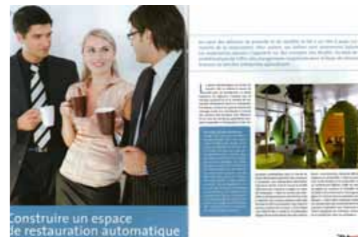
DA MAG N°88 - PAGE 1 MARS 2010 > Afficher le PDF