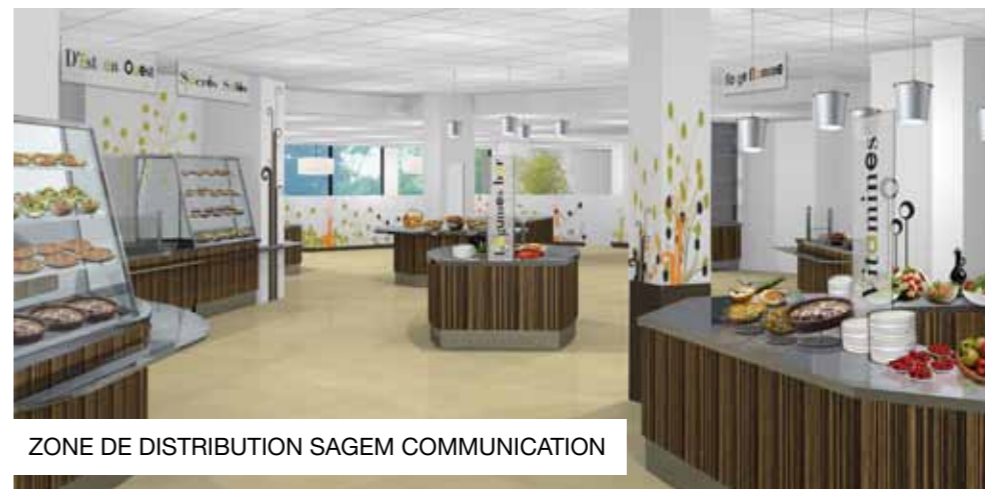
ZONE DE DISTRIBUTION SAGEM COMMUNICATION