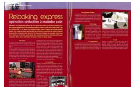
SNACKS & FOOD N°25 MARS 2009 > Afficher le PDF