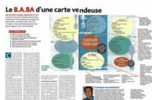
NÉORESTAURATION N°438 JANVIER 2007 > Afficher le PDF