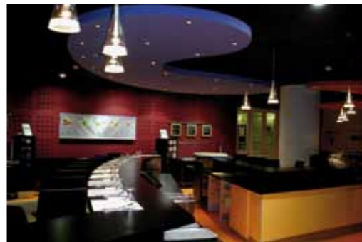
LA DÉFENSE / 2005 TOTAL