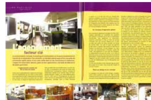
SNACK & FOOD N°16 JUILLET/AOÛT 2008 > Afficher le PDF