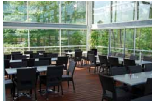
MT DE MARSAN / 2005 CENTRE E.LECLERC