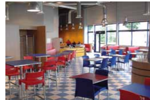
LA FLÈCHE / 2005 DINER RN23