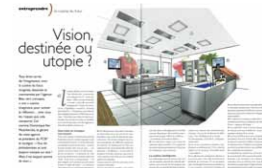
REST'HO NEWS N°14 DÉCEMBRE 2008/JANV-FEV 2009 > Afficher le PDF