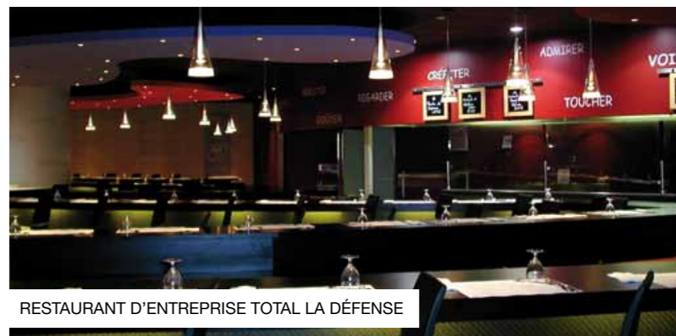
RESTAURANT D'ENTREPRISE TOTAL LA DÉFENSE