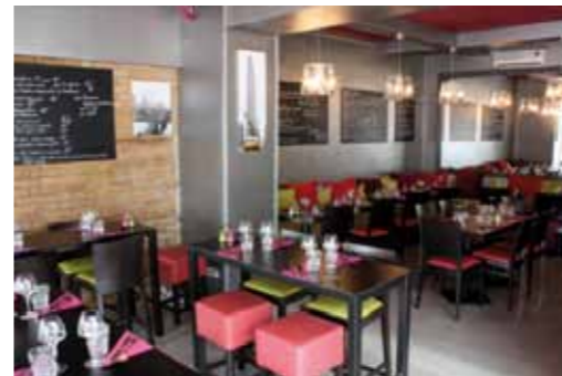
PARIS / 2005 / BRASSERIE CHEZ FRANÇOIS & CO