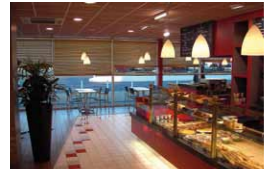
PARIS / 2005 NOMADE CAFÉ

agence de conseil en architecture intérieure bleu vert concepts