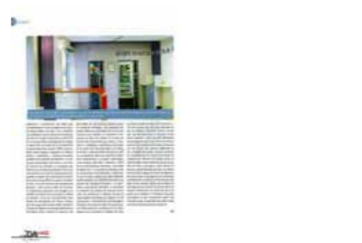
DA MAG N°88 - PAGE 3 MARS 2010 > Afficher le PDF