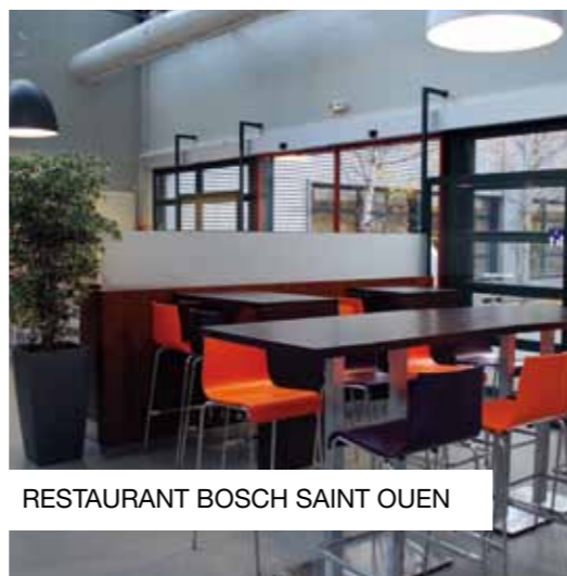
RESTAURANT BOSCH SAINT OUEN