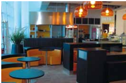
VANNES / 2009 LA TRANSAT'