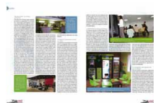
DA MAG N°88 - PAGE 2 MARS 2010 > Afficher le PDF