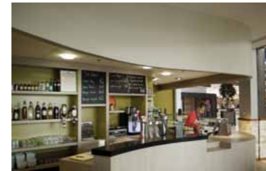
PARIS / 2005 AU CAFÉ GOURMAND